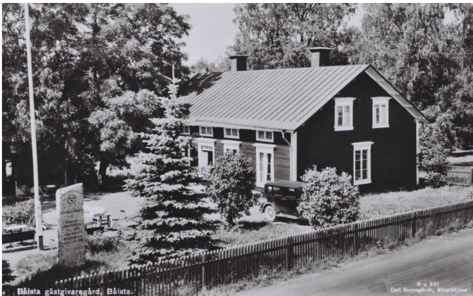
Sigtuna skvadrons sten på sin ursprungliga plats invid Bålsta gästgivargård

Tidigare hade Sigtuna skvadron nyttjat Örsundsbro och efter 1695 Litslena som samlingsplatser. Från åtminstone 1800-talet synes mötena omväxlande ha skett vid Grans gästgivargård i Yttergran socken och Tibble gästgivargård i Håbo-Tibble socken. För 1852 kungjordes att appbrotations- och kassationsmönstring för Sigtuna skvadron skulle ske vid Litslena gästgivargård, medan platsen var Grans gästgivargård 1854. Skvadronens hästbesiktning möten 1906 – kanske de sista? – genomfördes vid både Grillby och Bålsta järnvägsstationer.