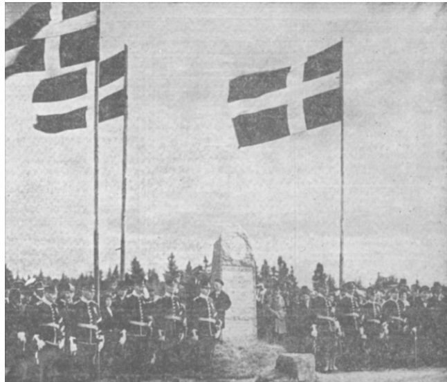
Tidningsbild från invigningen