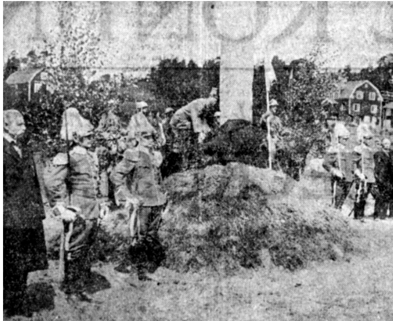
Invigningen uppmärksammades stort i Svenska Dagbladet

En av de mest aktiva initiativtagarna till en minnessten torde ha varit greve Folke Bernadotte, officersutbildad vid Livregementets dragoner. Han var dessutom bosatt i Dragongården, regementets tidigare kanslihus och officersmäss vid Djurgårdsbrunnsviken. Medel till stenen samlades in genom Livregementets till häst officerskår, där Bernadotte lär ha bidragit med halva beloppet.