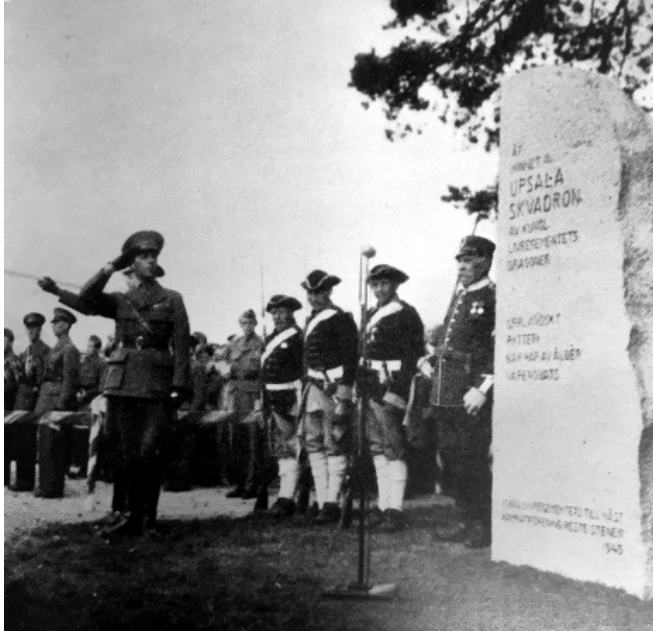
Arvprinsen vid minnesstenen