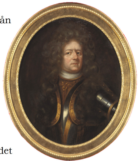
Otto Wilhelm von Königsmarck (1639–1688)

Regementet bestod då av åtta kompanier: tre från Uppland, ett från Södermanland, två från Västmanland, ett från Närke samt ett från Värmland. Ytterligare fyra kompanier nyuppsattes 1674 i Västmanland (två kompanier), Uppland respektive Västergötland. Vid regementets omorganisation 1791 bildade Livkompaniet, Majorens kompani, Roslags kompani, Norra Upplands kompani samt Södermanlands kompani Livregementsbrigadens kyrassiärkår. Redan 1804 överfördes det sistnämnda till Livregementsbrigadens lätta infanteribataljon (det blivande Livregementets grenadjärer).