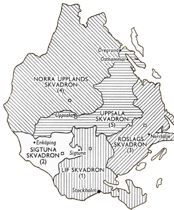
Skvadronsindelning för Livregementets dragoner 1834

Livregementets dragonkår, vilket från 1893 ersattes med Livregementets dragoner. När organisationen för hela det indelta kavalleriet skulle likriktas 1834, ändrades benämningen för regementets underavdelningar från kompani till skvadron. Varje regemente, med undantag av de två stora skånska kavalleriregementena, skulle bestå av fem skvadroner. För Livregementets dragonkår innebar det att en femte skvadron, Uppsala skvadron, bildades genom att nummer överfördes från de fyra ursprungliga kompanierna. Vid samma tid namnändrades Majorens kompani till Sigtuna skvadron.