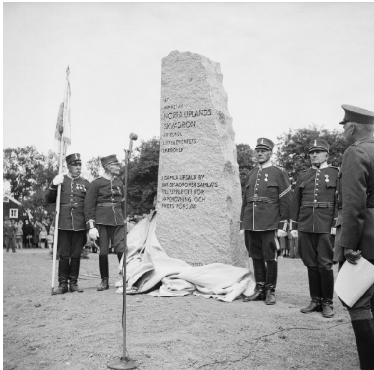
Dragoner flankerar stenen under sekundchefens tal